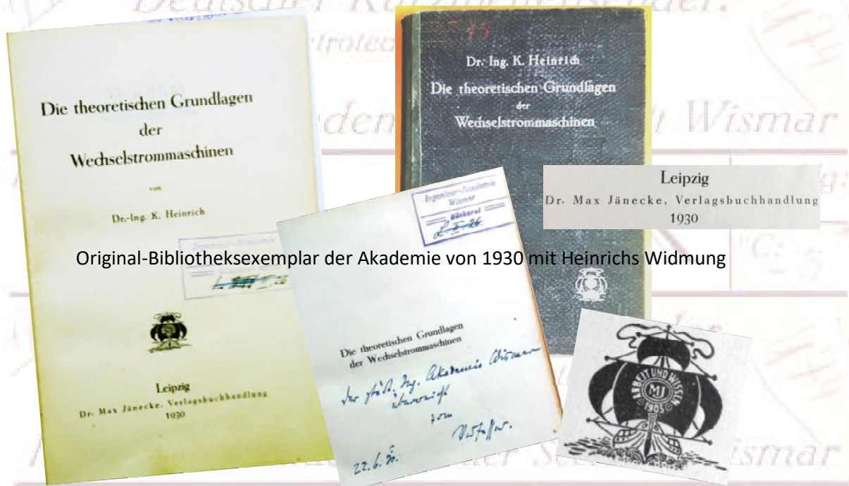
Original-Bibliotheksexemplar der Akademie von 1930 mit Heinrichs Widmung

Copyright Uwe Hansen / Autor im Heft 24 der WB 2018 der Seiten 2 bis 19 (umfanglich dazu www.dl2swr.afu-wismar.de )